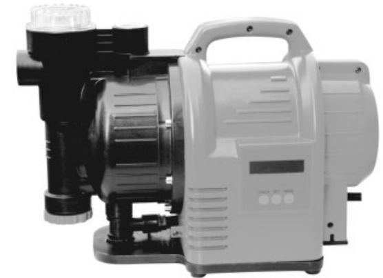
XK 09 E