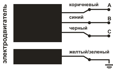
Рис. 4 Принципиальная электрическая схема

Наращивание электрического кабеля должно осуществляться посредством термоусадочной муфты с клеевым внутренним слоем, обеспечивающим герметичность соединения.